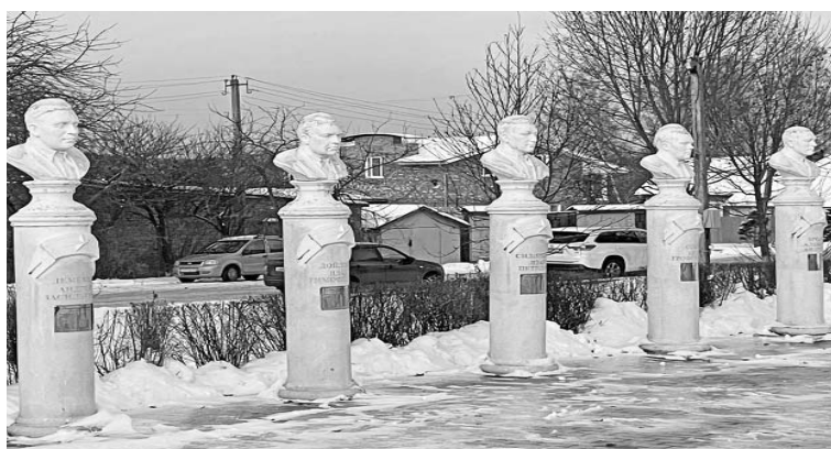
Пятеро наших земляков удостоены звания Героя Советского Союза.

В 2007 году Государственная Дума установила новую памятную дату: 9 декабря – День Героев Отечества. В этот день, когда православная церковь чтит память святого Георгия, в 1769 году был учрежден орден, ставший высшей военной наградой Российской империи.